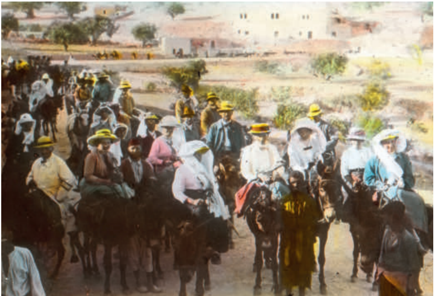
Pilgerritt nach Betanien, man beachte die zahlreichen Frauen

„Ich kann nur bestätigen, daß wir von der Wallfahrt der Frauen die besten Eindrücke empfangen haben. Es spricht vieles für die Wallfahrt der Frauen, nur wenig dagegen. Dagegen: daß ein ‚gemischter‘ Zug komplizierter ist als ein einfacher Männerzug. Dafür aber sprechen: daß die Frauen mindestens so fromm wie die Männer sind; daß sie im Hause das wirtschaftlich sparende Element sind, das schon darum Rücksicht verdient; daß die Frauen mindestens so viel aushalten als die Männer, weil sie im allgemeinen auch diäter leben und weniger trinken; daß die Frauen mindestens so gefügig sind wie die Männer; endlich, daß es für die religiöse Erziehung und Hal-