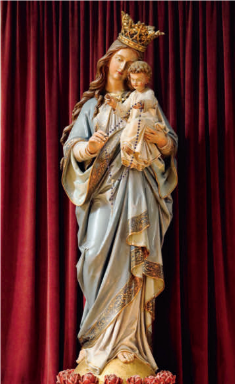
Pilgermadonna im Dom Linz