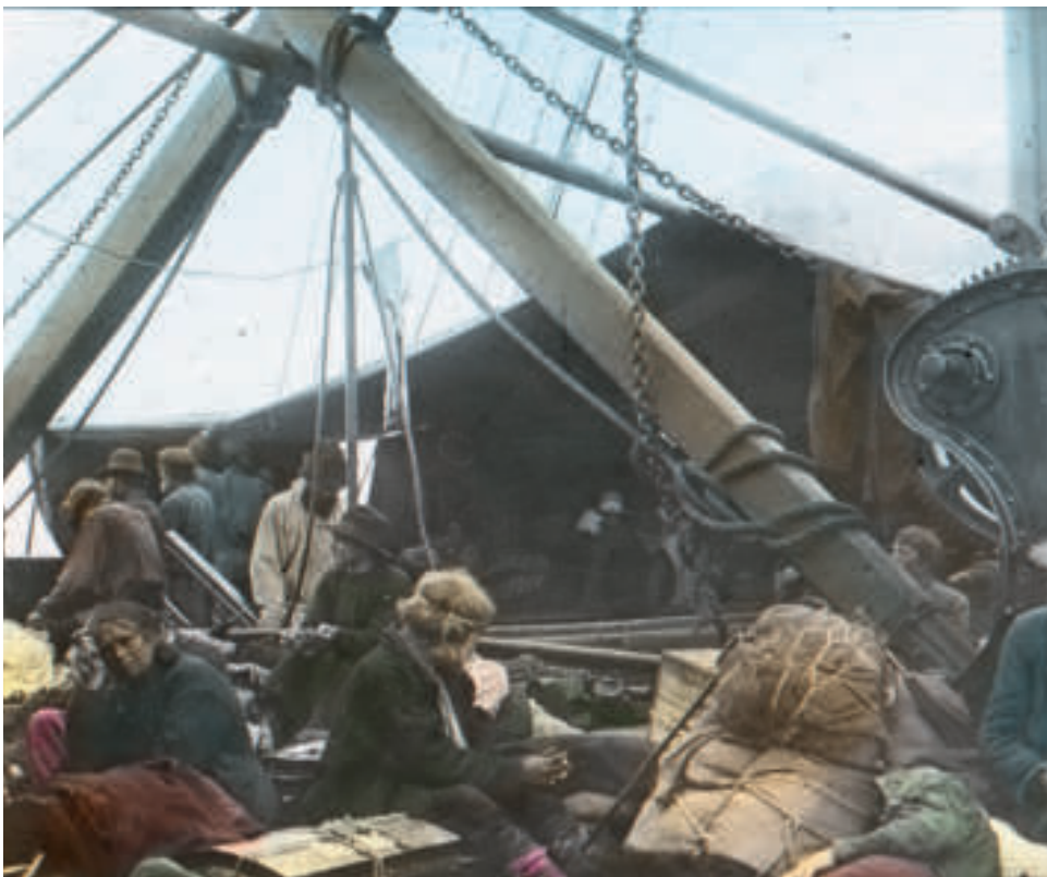
Pilger an Bord eines Schiffes zum Heiligen Land

Reiseprogramm 469 Teilnehmer – 290 Männer und 179 Frauen – des II. oberösterreichischen Pilgerzuges im Jahre 1904 ins Heilige Land.