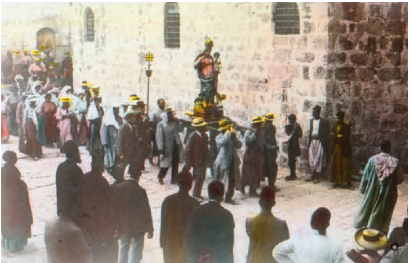
Einzug von Pilgern in die Grabeskirche Jerusalem

Ein prächtiges Bild bot das bewegte Leben und Treiben in den Straßen der Stadt Linz in den Morgenstunden des 17. April. Aus allen Vierteln unseres gesegneten Oberösterreich waren aus Stadt und Land die Pilger und Scharen des Volkes gekommen, der grüne Jägerhut, wie ihn die Salzkammergütler tragen und das schwarzseidene Kopftuch, die schmucke Nationaltracht unserer